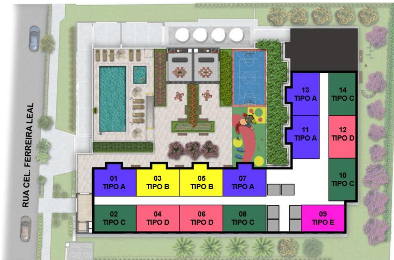
PLANTA 19º E 20º PAVIMENTO