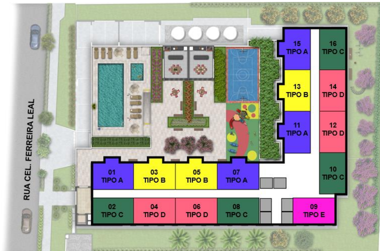
PLANTA PAV. TIPO (3º AO 18º PAVIMENTO)